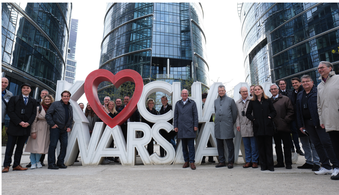
Gruppenfoto der interessierten Handwerksdelegation beim Besuch in Warschau

»» Polen ist ein starker und interessanter Wirtschaftspartner. ««